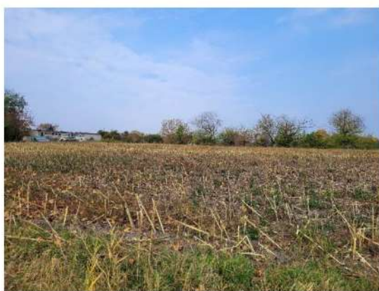
Foto 9. Widok na działkę