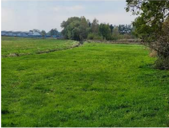
Foto 13. Widok na działkę w części wschodnie