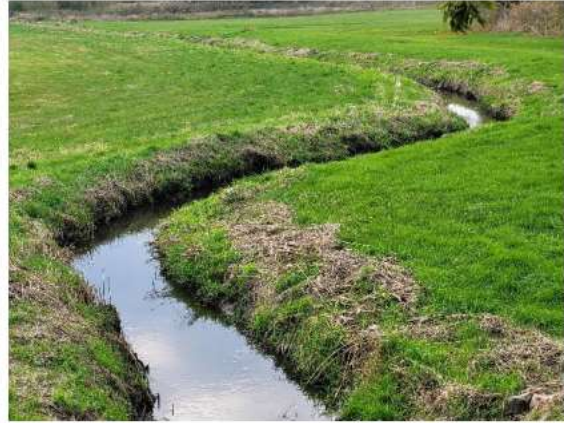
Foto 14. Rzeka Utrata stanowiąca granicę działki od wschodu