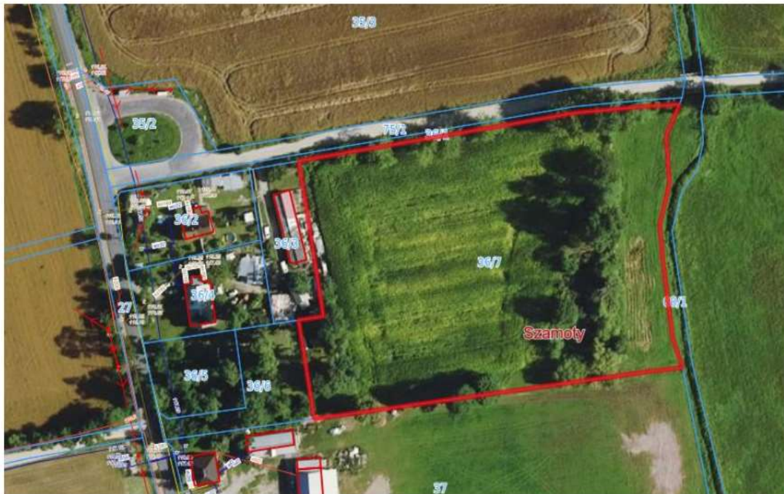
Rys. 4 Obrys przedmiotowej działki