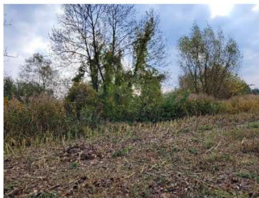
Foto 12. Pas drzew rozdzielający pola uprawne i łąkę