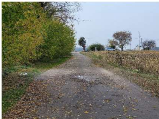
Foto 5. Widok ulicy Dworskiej w kierunku ulicy Nadarzyńskiej