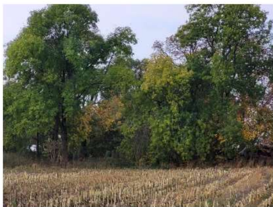
Foto 11. Zadrzewienia na działce