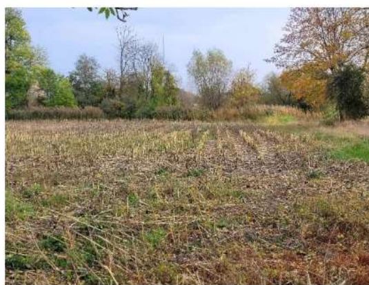
Foto 10. Widok na działkę od zachodu