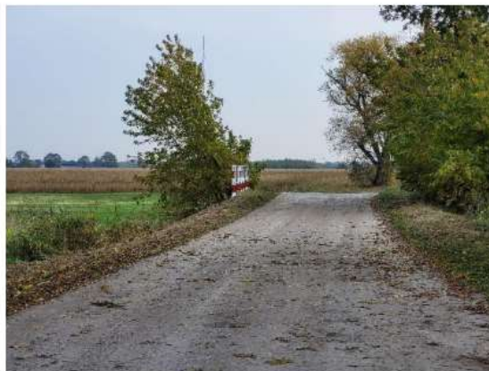
Foto 6. Widok na ulicę Dworską w kierunku wschodnim