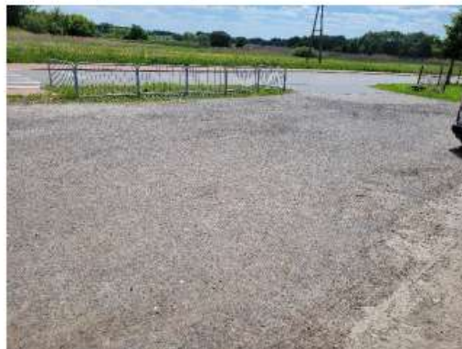
Foto 12. Utwardzenie przed budynkiem