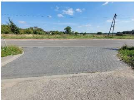
Foto 11. Wjazd od strony Przęstawic