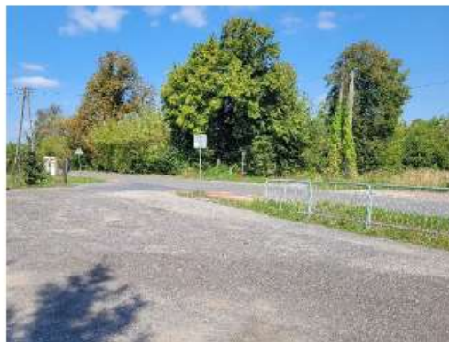
Foto 10. Wjazd na nieruchomość od strony północnej