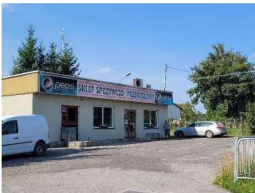
Foto 9. Widok na nieruchomość z ulicy

Nieruchomość zabudowana jest budynkiem handlowym oznaczonym na mapie ewidencyjnej nr 78, pełniącym aktualnie funkcję sklepu spożywczo – przemysłowego. Jest to obiekt parterowy, niepodpiwniczony, wybudowany w technologii tradycyjnej (obmurowana rama stalowa) i zabudowie wolnostojącej, w latach 70 – tych XX wieku. Powierzchnia zabudowy budynku równa jest 116 mkw., zaś jego powierzchnia użytkowa wynosi 101,57 mkw. Budynek jest w dobrym stanie technicznym.