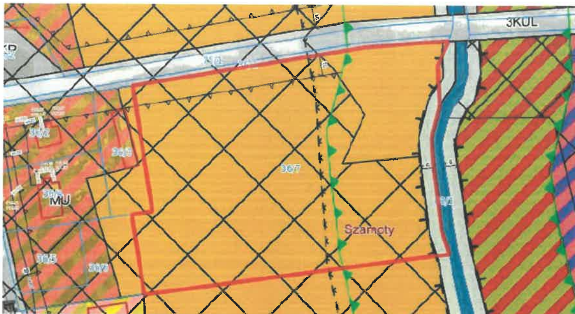
Rys.1 Oznaczenie przeznaczenia nieruchomości wg Miejscowego Planu Zagospodarowania Przemysłowego.