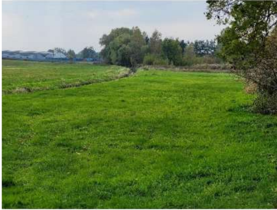
Foto 13. Widok na działkę w części wschodniej