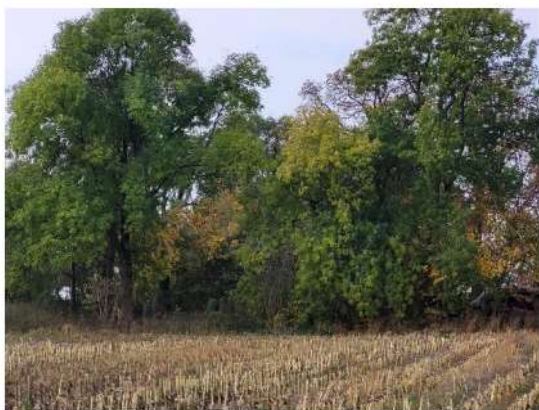
Foto 11. Zadrzewienia na działce