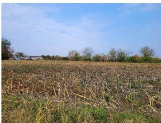
Foto 9. Widok na działkę