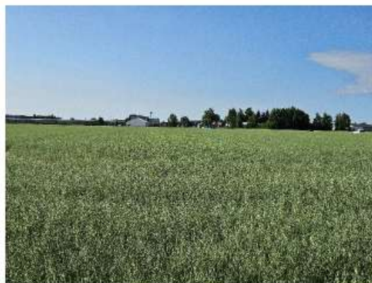
Foto 18. Widok na działkę z Dworskiej