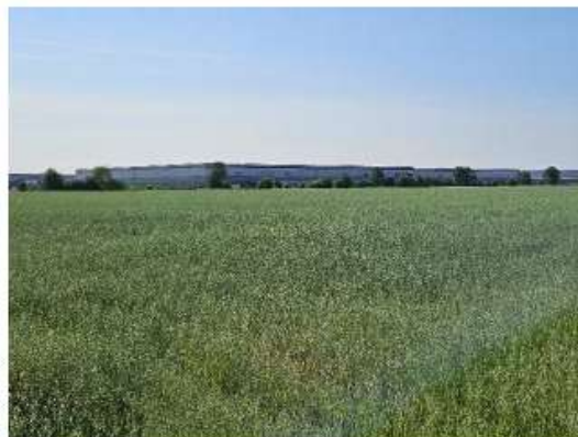
Foto 16. Widok na działkę z ulicy Wiatrakowej