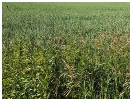
Foto 20. Uprawy na przedmiotowej działce