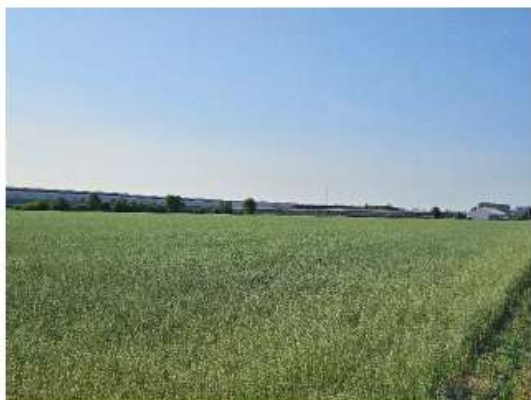
Foto 17. Widok na działkę od północy