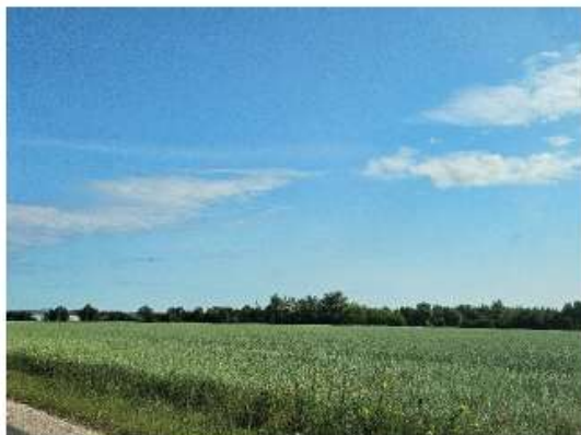
Foto 15. Teren nieruchomości

Zgodnie z danymi z ewidencji gruntów, działka ew. nr 77/3 ma obszar 117116 mkw. i złożona jest z dwóch rodzajów użytków. Ponad 98% z nich stanowią grunty orne klasy V. Nieco ponad 1,5% stanowią natomiast grunty pod rowami.